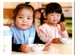
預かり保育（午後のおやつ）