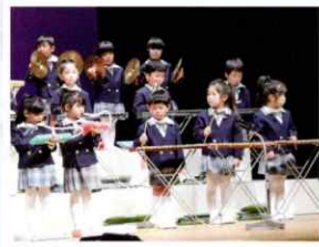
音楽リズム発表会（合奏）