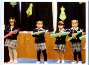
クリスマス会（メロディオン）