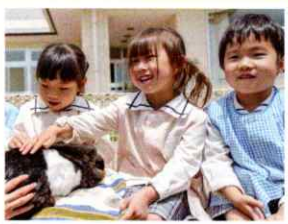
うさぎと触れ合う