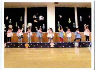
クリスマス会（楽器）