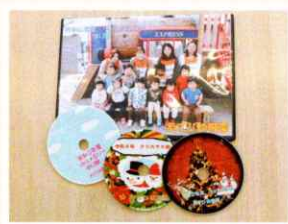
あさひっこレポート（DVD）