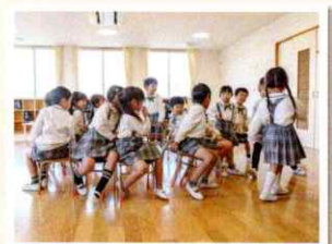
預かり保育 （春・夏・冬休みの希望保育あり）